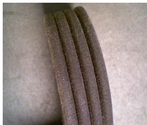
Primjer preinačenog klinastog rebrastog remena

Preinačeni remeni mogu se neograničeno upotrebljavati za primjene u vozilima koje su navedene u katalogu. Unatoč optičkim razlikama nova izvedba nema nikakvih nedostataka u pogledu performansi.